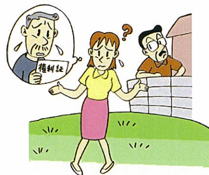
③相続を受けた土地の正確な位置がわからなかった。