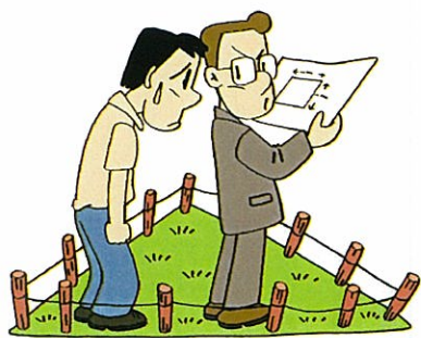
①土地を購入し、改めて測ってみたら登録簿の面積と違っていた。